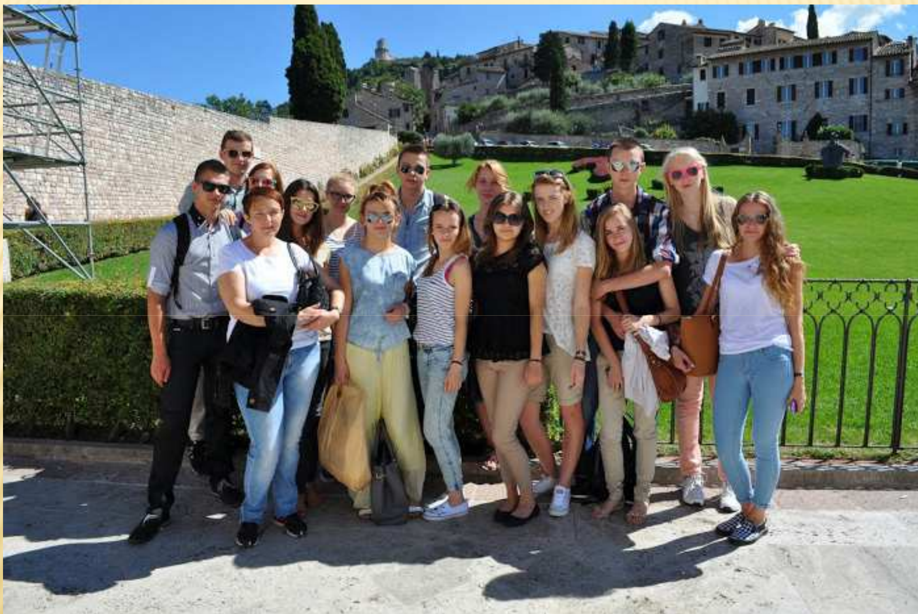
Przed Bazyliką św. Franciszka w Asyżu