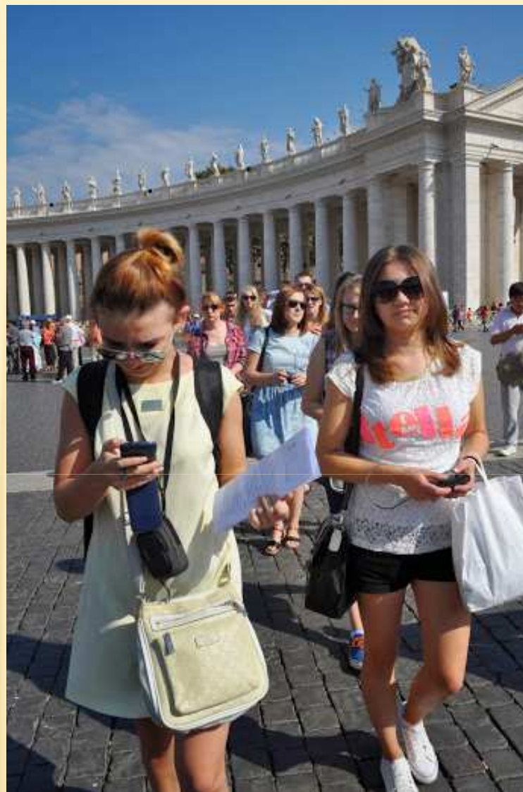
W kolejce do Bazyliki św. Piotra