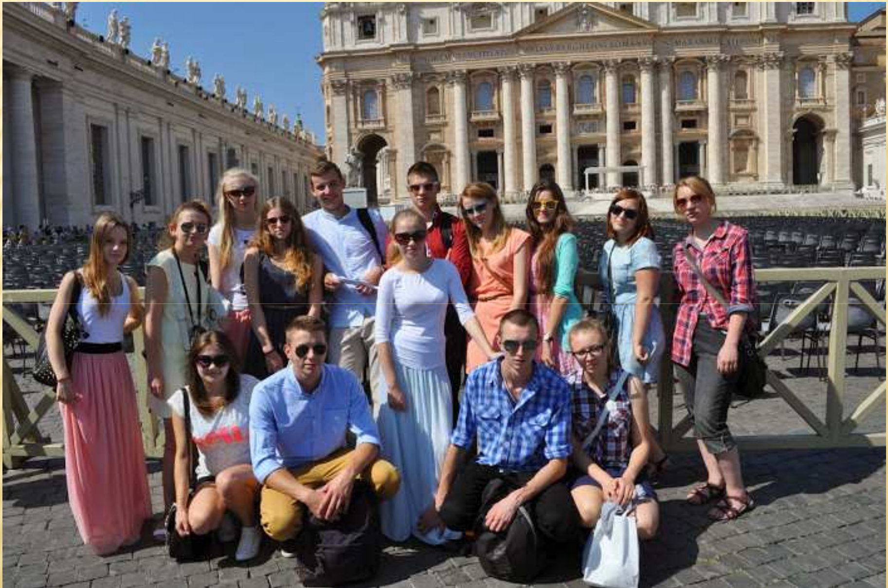
Na Placu św. Piotra