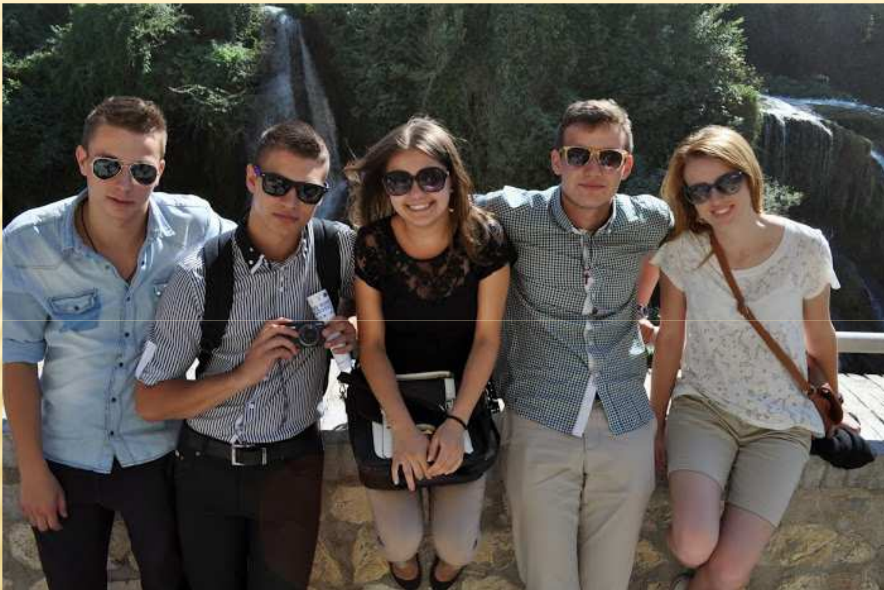
Za nami Wodospad Cascate delle Marmore