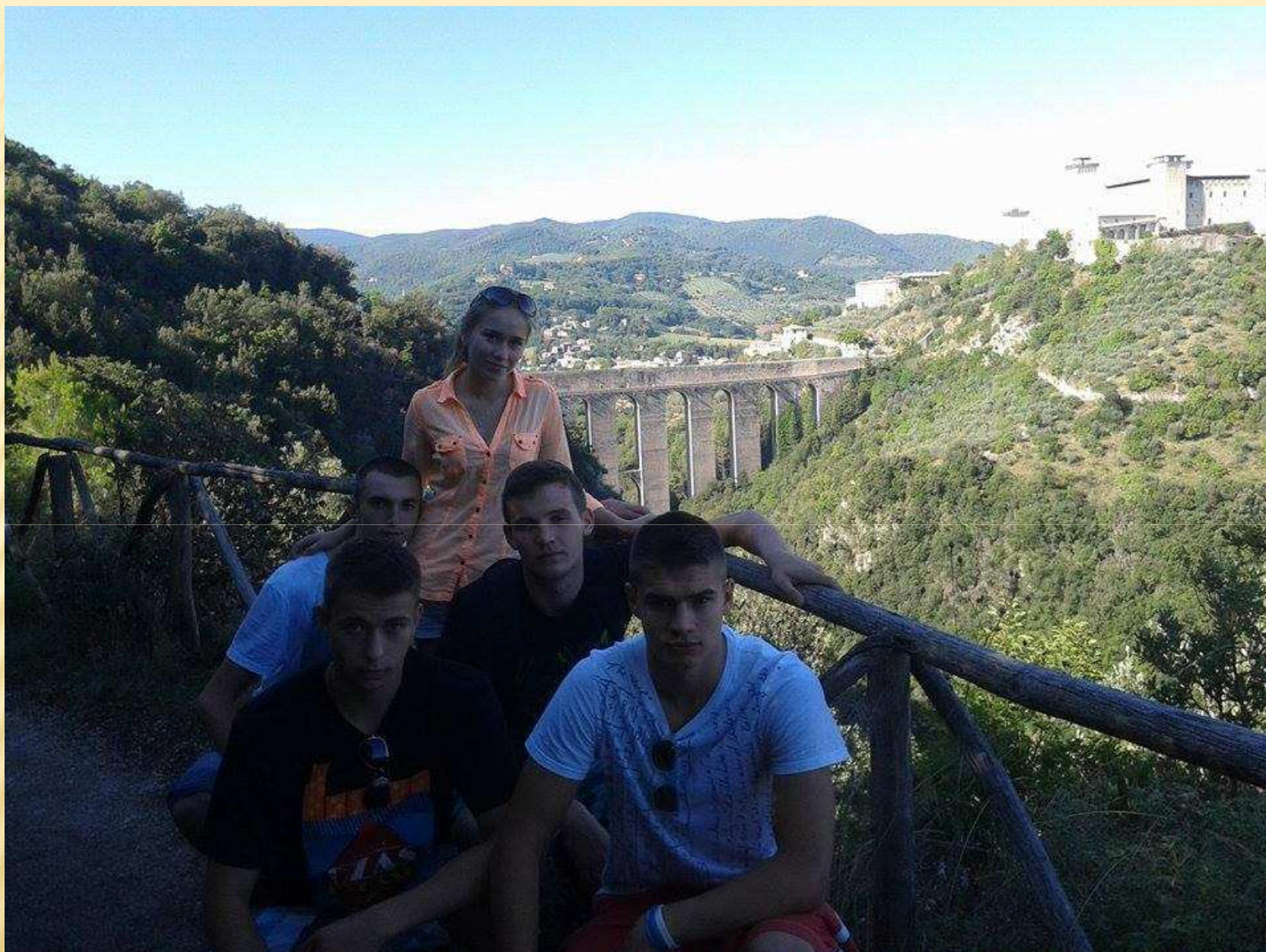
Wycieczka na Montelucio