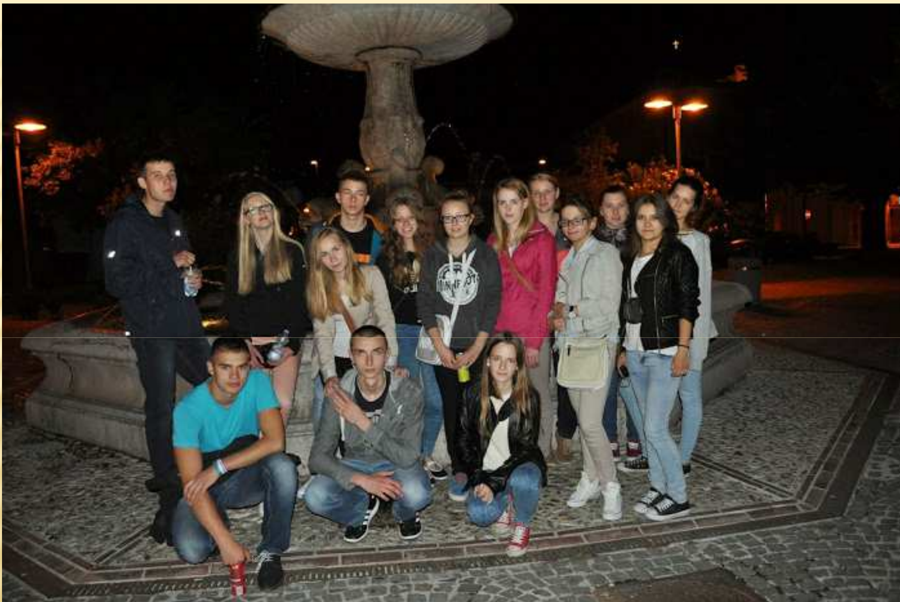
Pierwszy wieczorny spacer po Spoleto.